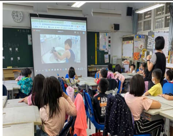
分享洗刷刷小短片