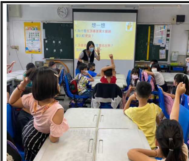
大家一起來看影片「飛吧!竹蜻蜓~頂番婆」小短片 並提問與思考