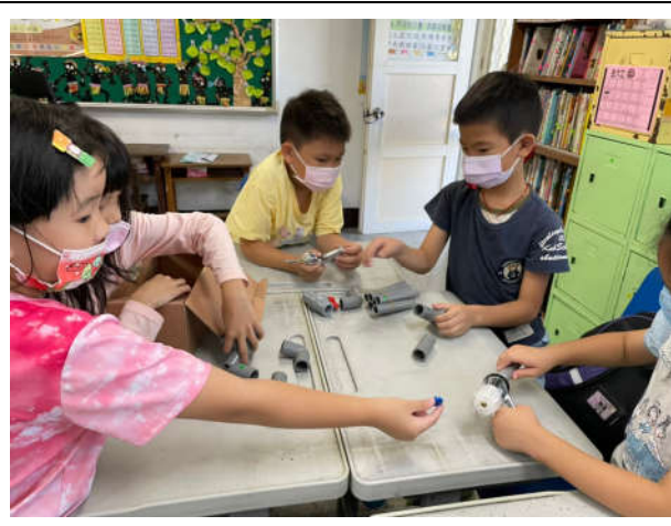
快樂的DIY《水龍頭的分類與組裝》