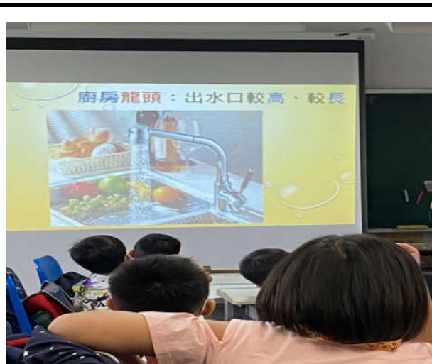
認識水龍頭的功用