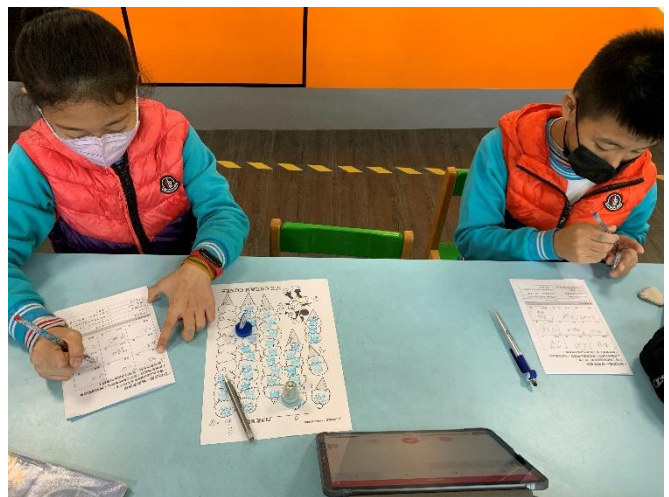
利用賓果遊戲檢核學生學習成效