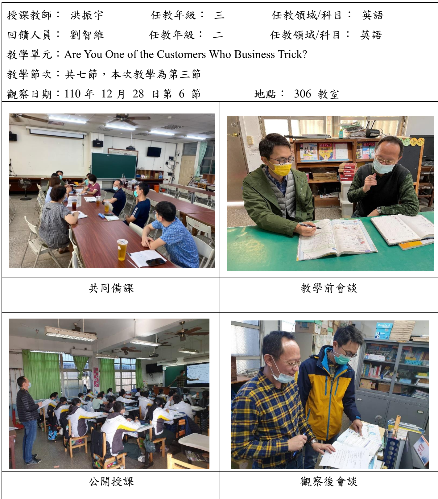
表 4、教學觀察/公開授課—活動照片