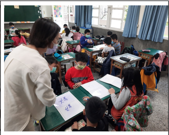
觀課後回饋會談照片