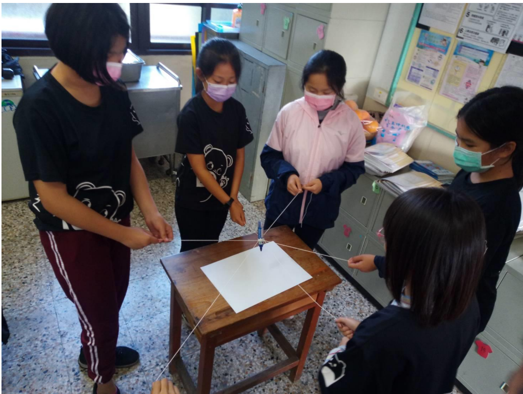
透過活動體會自己在分工合作中的角色和重要性