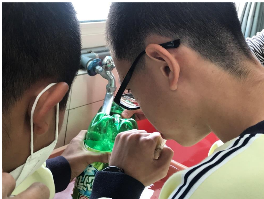
透過實作活動進行教學活動