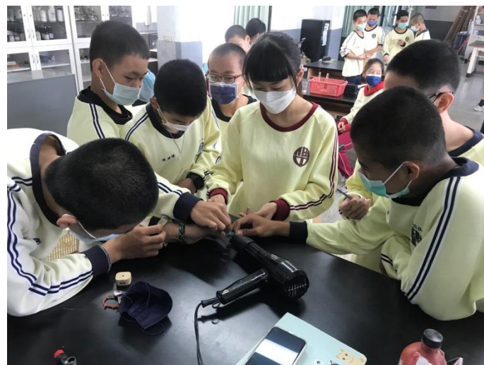
學生配合老師講解實地完成氯化亞鈷試紙檢測水分實驗