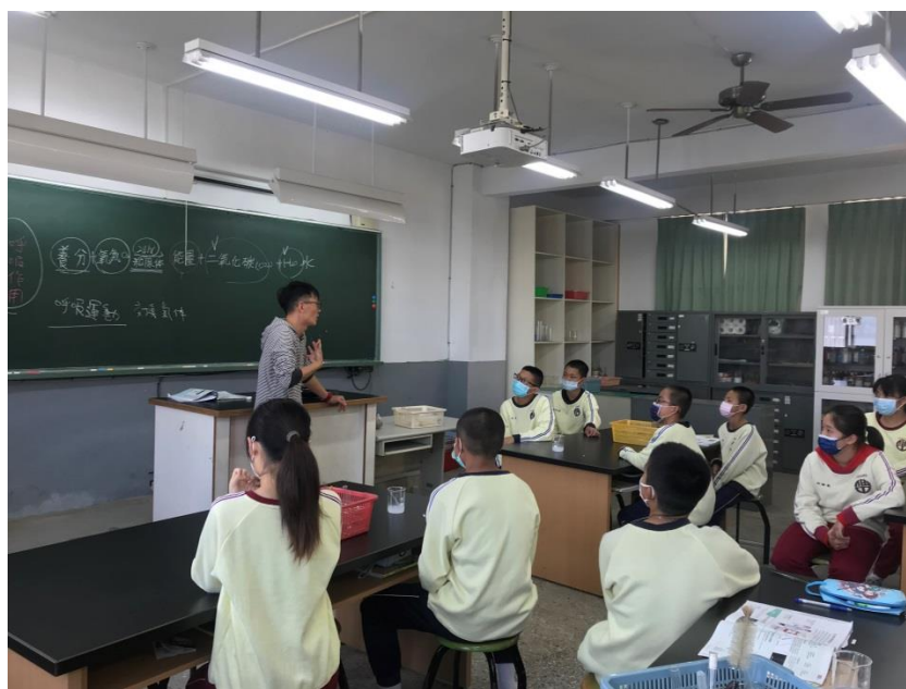
教學觀察學生專心上課及參與回答學生專心上課及參與回答