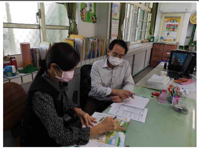
說明：觀課老師和授課老師針對公開課做建議與回饋