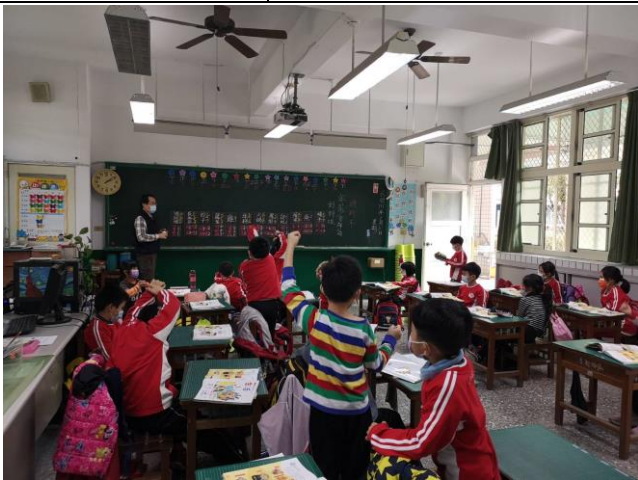
說明：年菜吉祥話對對碰遊戲