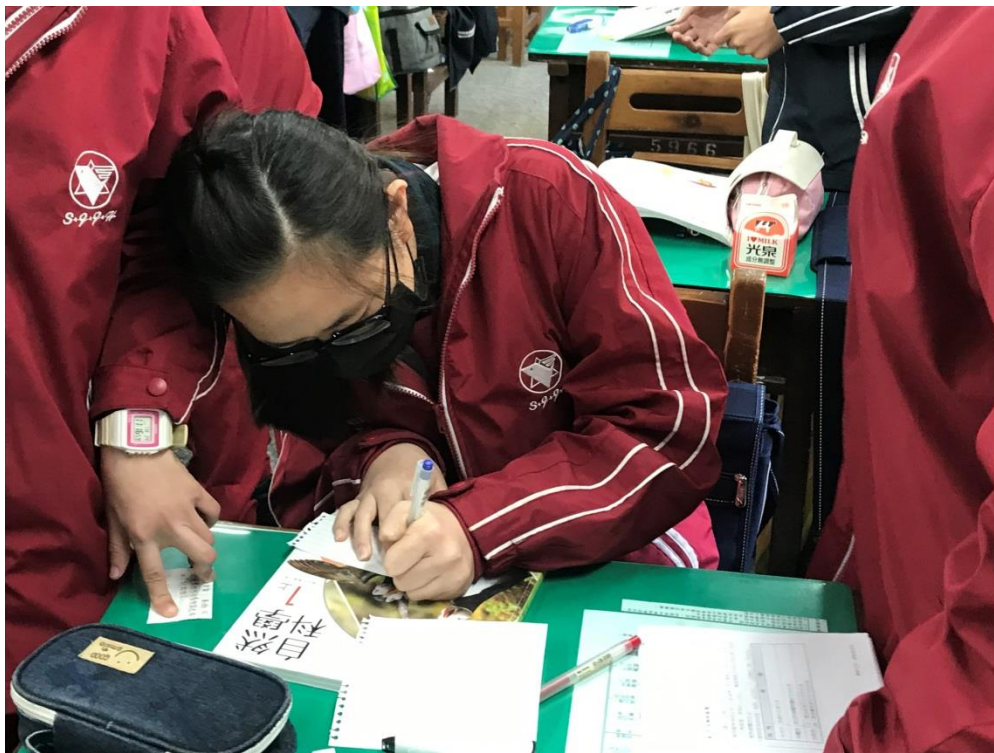
學生配合老師講解積極討論複習內容