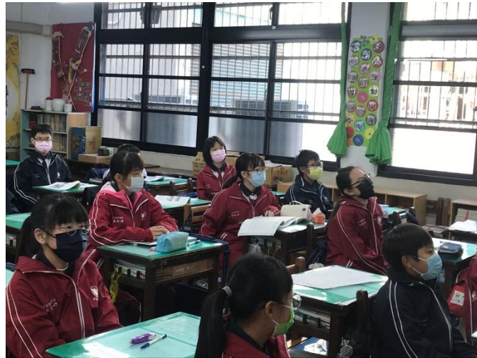
教學觀察學生專心上課及參與回答