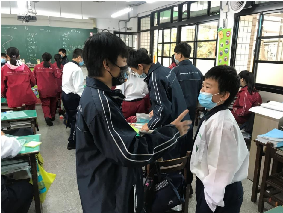
學生配合老師講解實地討論複習內容