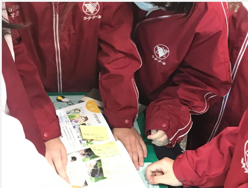
學生認真聆聽老師說明並認真出題