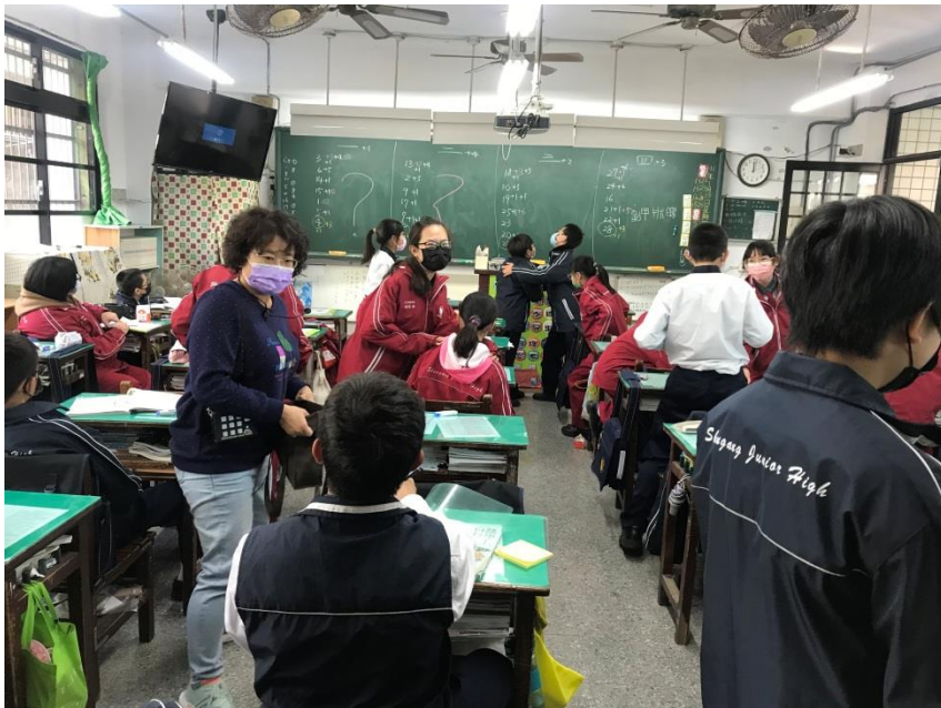
老師樂於回應學生的反應