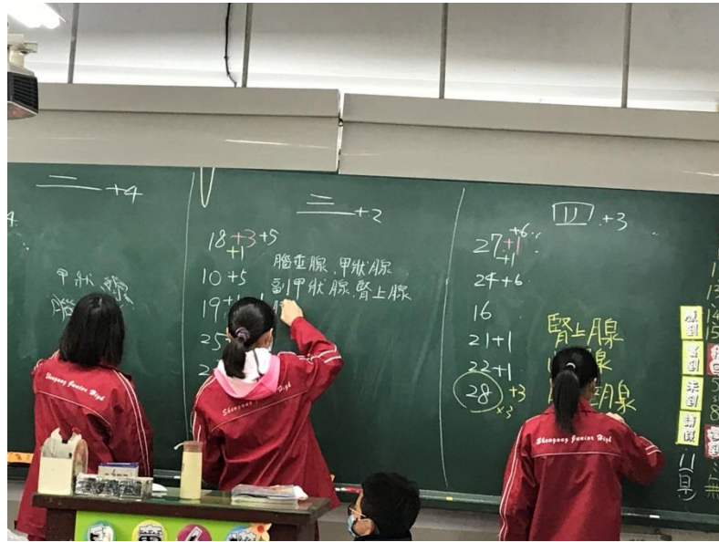
透過實作活動進行教學活動