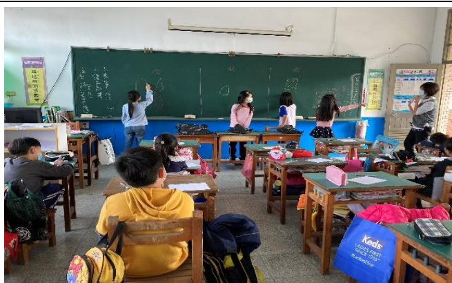
請學生畫出觸摸下的物品樣貌。