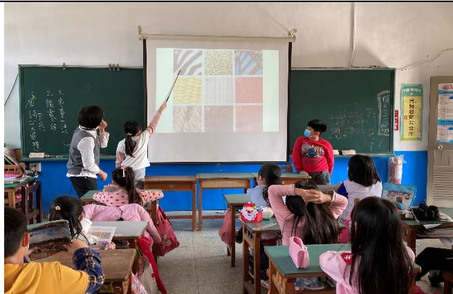
學生從物體的局部紋路做整體的猜測。