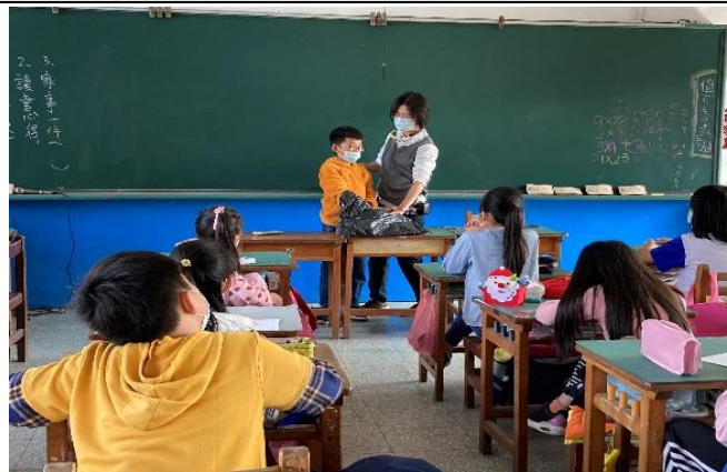
學生透過手部的觸摸，猜測袋子中的物品。