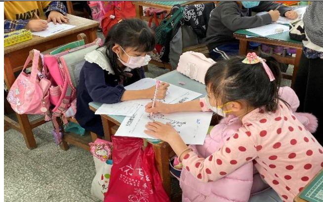
發揮創意，將生活中的物體進行紋路改造，發現新樣貌。