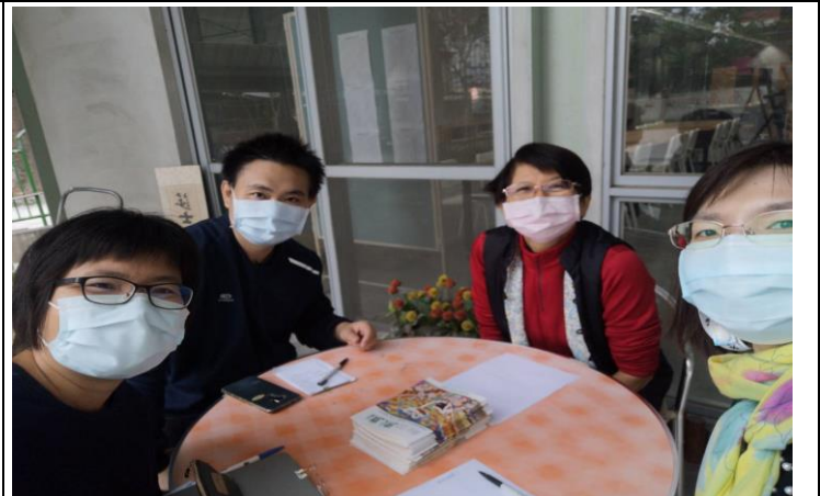
觀課後會談(圖書館前)