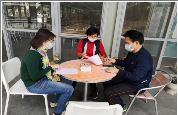
觀課後會談(圖書館前)