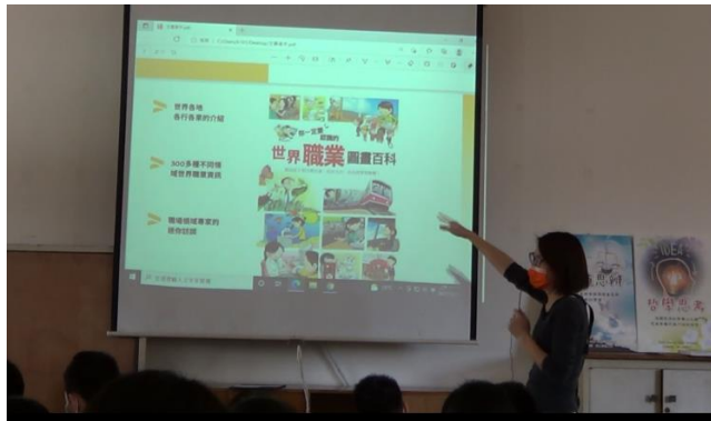
說明世界職業圖書百科課堂內容