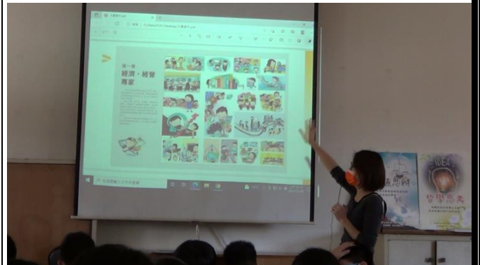
說明世界職業圖書百科課堂運用方法