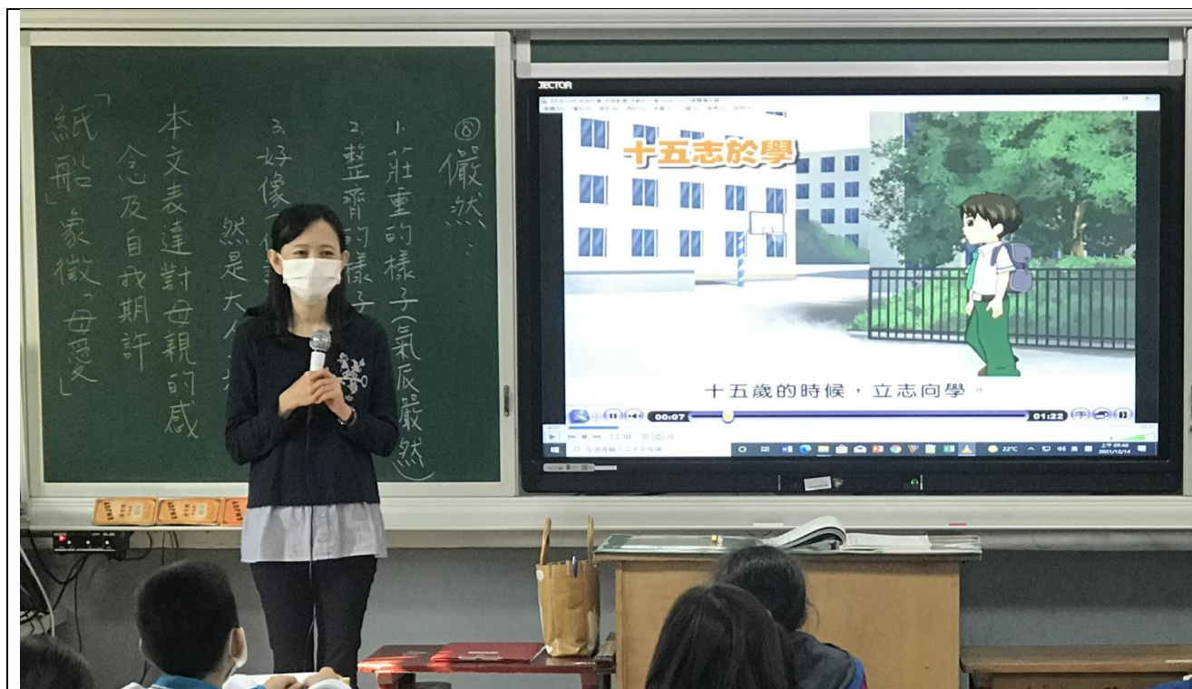
照片1說明：教師講述並補充說明