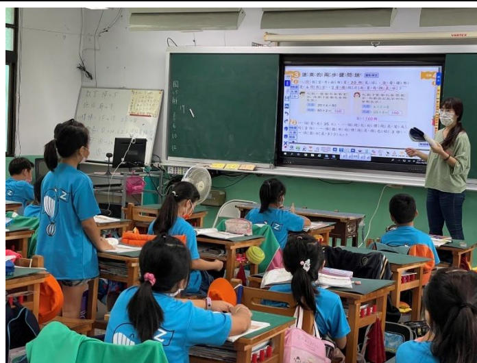
教師說明解題步驟並詢問學生是否還有其他解題方式