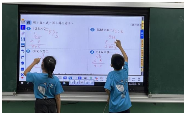
學生上台書寫習作第 43 頁練習題