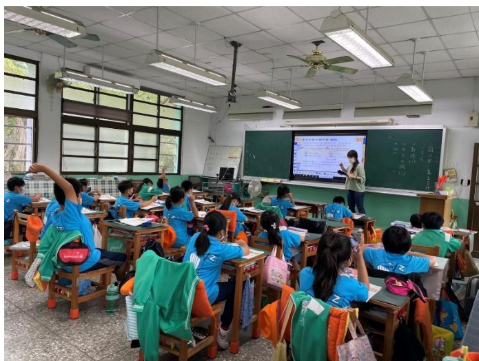
教師講解題目內容