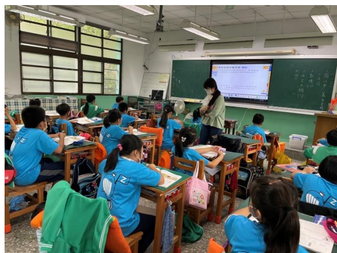
學生讀題教師行間巡視