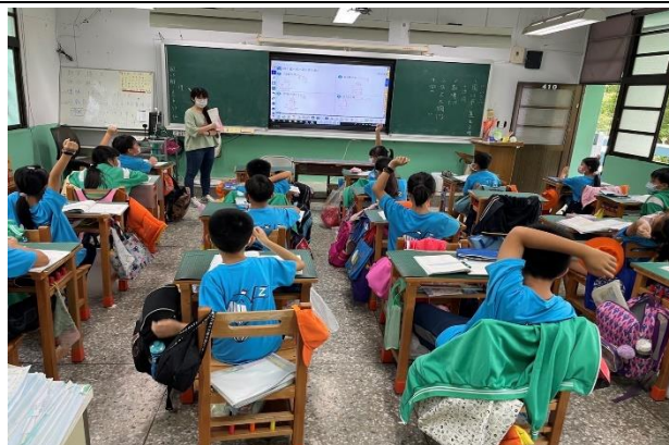
教師詢問學生練習題答對的題數