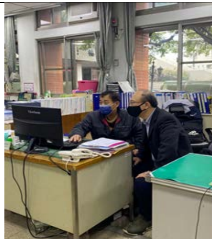
議課 (日期:110.11.18 )