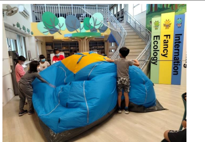
分工合作收好帳篷