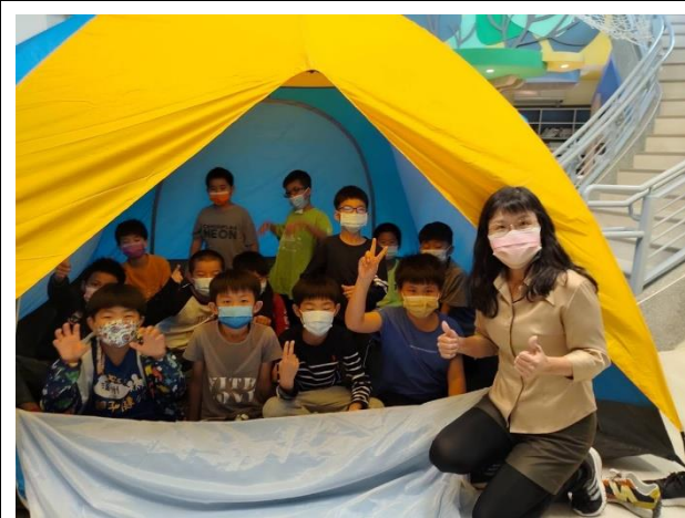
大功告成太開心了