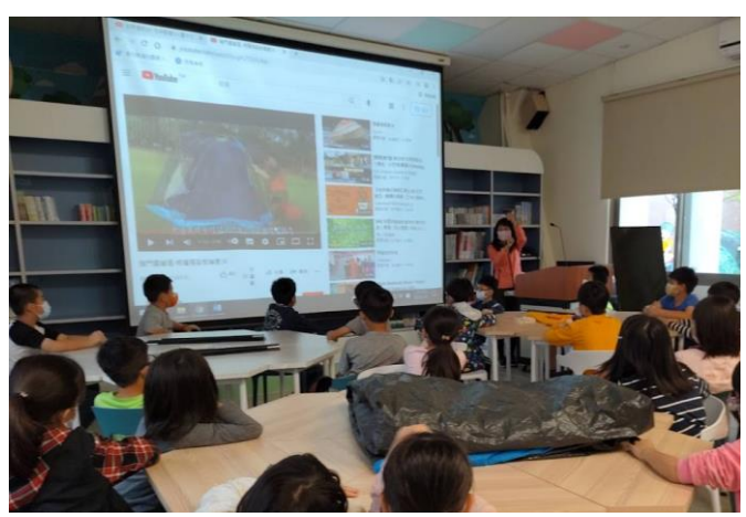
如何搭帳篷影片教學