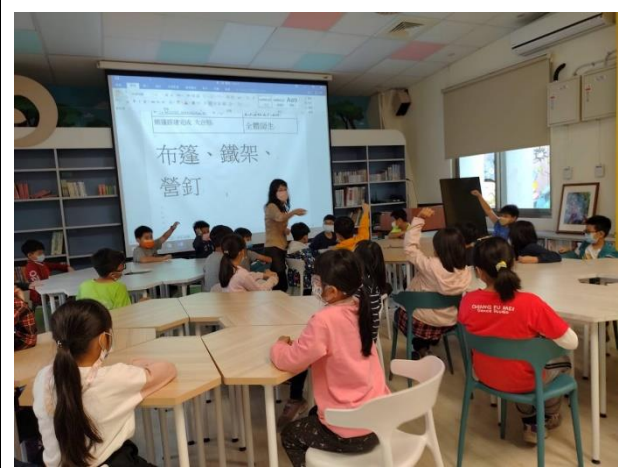
認識帳篷閩南語語詞教學