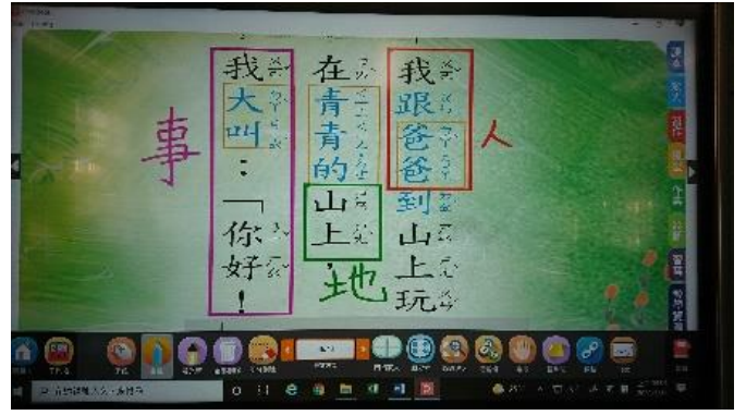
找出文本重要訊息