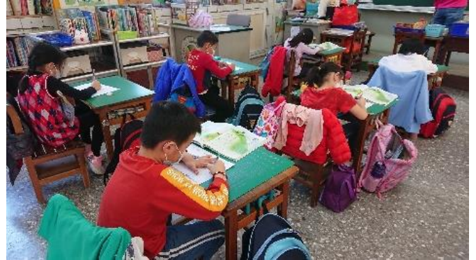
學生實作：書寫心智圖