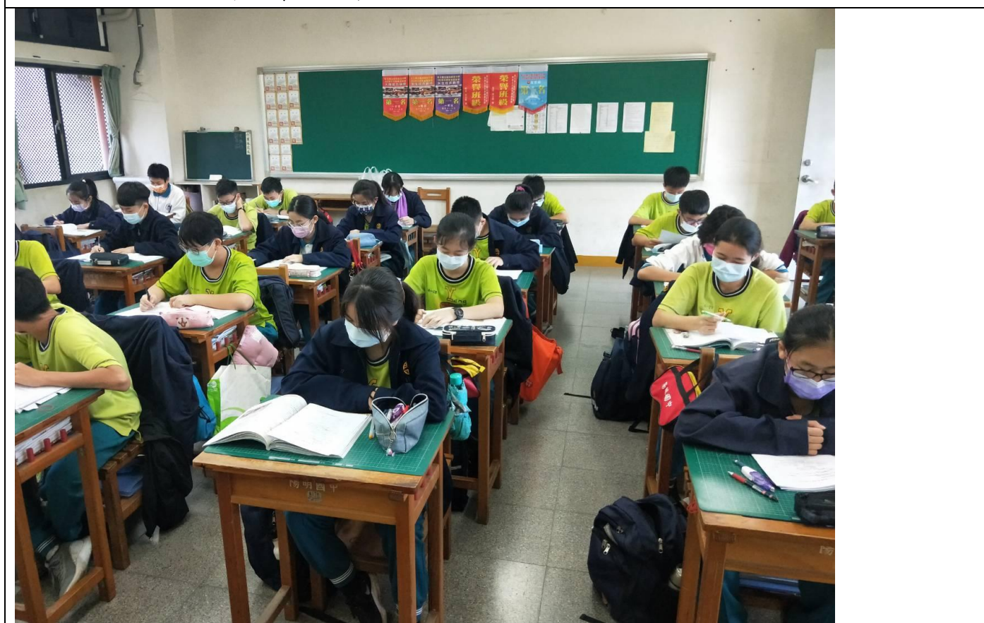
照片2說明：學生閱讀教材內容