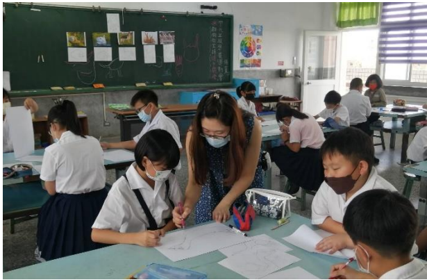
說明：逐桌示範與修正