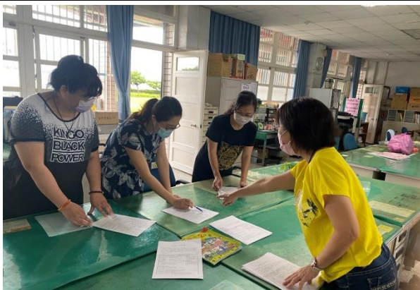
說明：檢討與分享授課優缺點 1