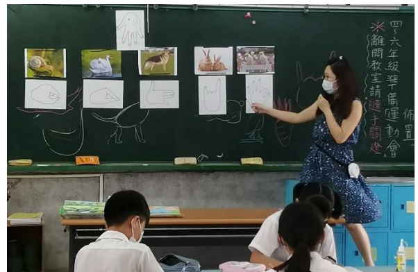
說明：分別講解聯想動物手勢圖