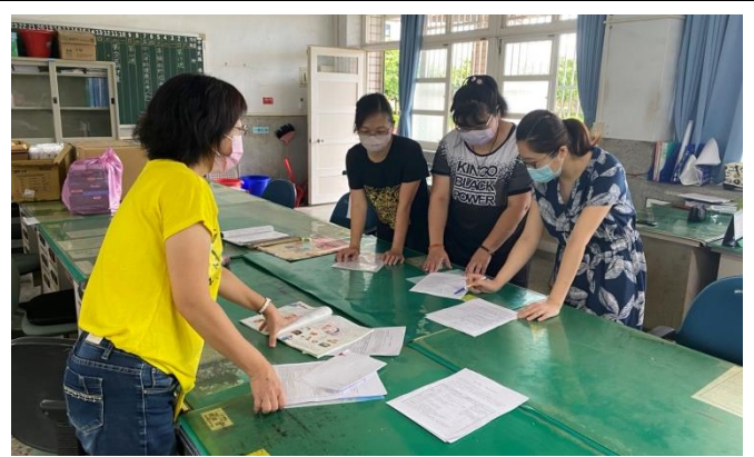
說明：檢討與分享授課優缺點 2