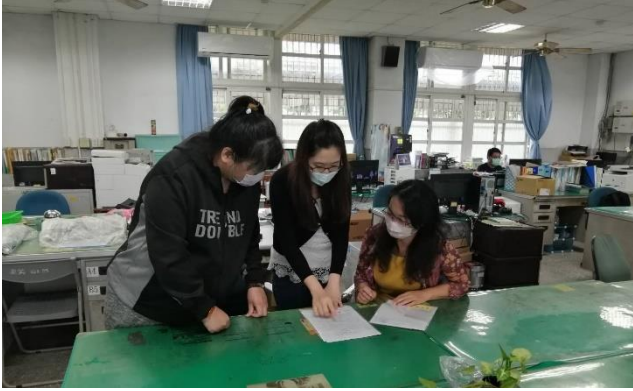
說明：討論課程內容