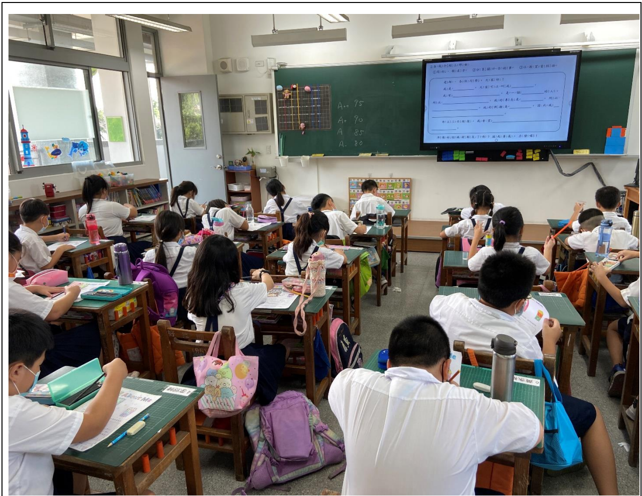
活動：三丙公開課——完成第一課學習單 日期：110/09/14