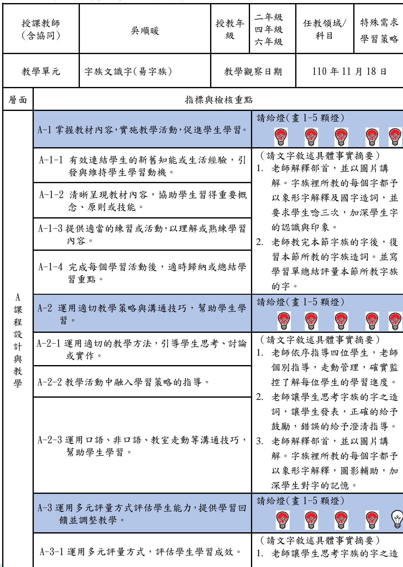
表 2、觀課紀錄表(會後請交回工作人員)