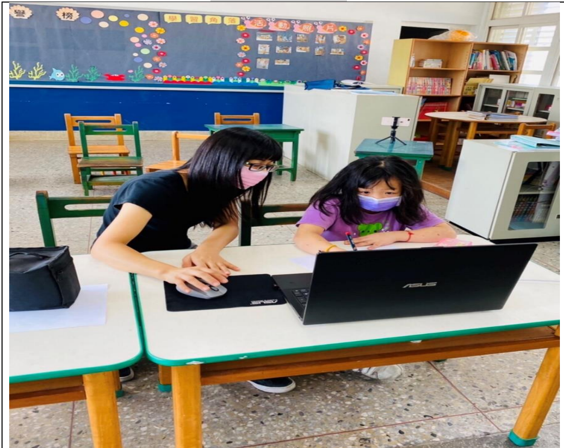
~ 課程教學中 ~