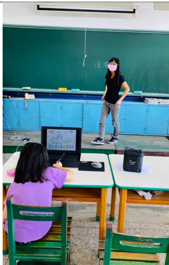
~ 學生認真聆聽 ~