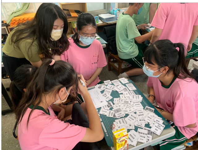
公開授課，分組進行桌遊活動。