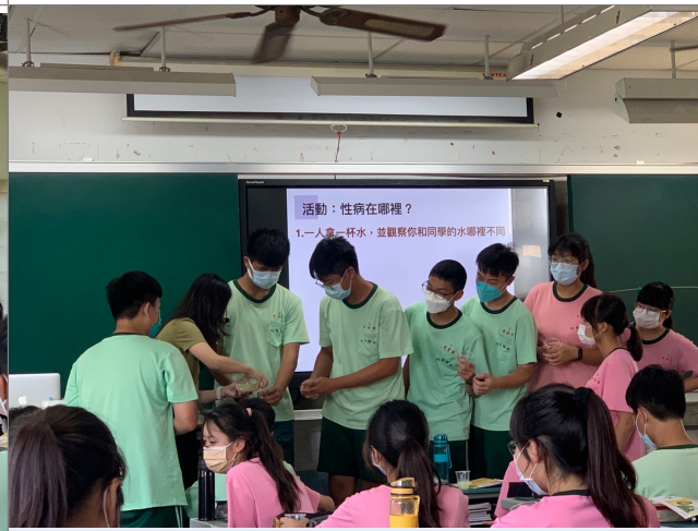
公開授課，性傳染病體驗活動。