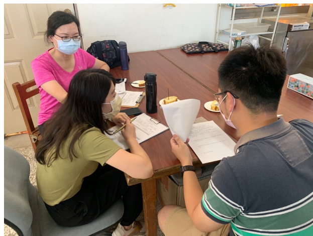
課前說明學生情況及觀察要點。