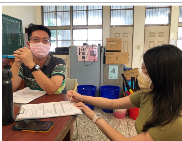
觀察後會談，提供建議。