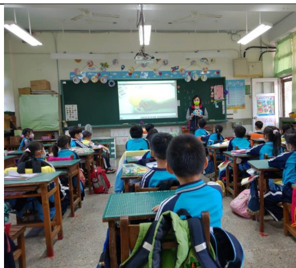
展示樣品的成品給學生觀看