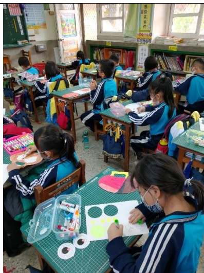
學生開始進行創作