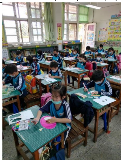
學生認真製作作品