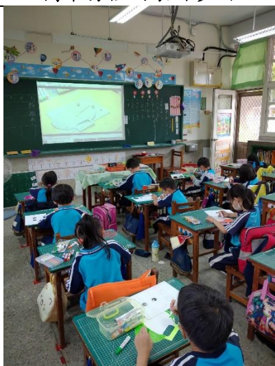
學生認真製作作品