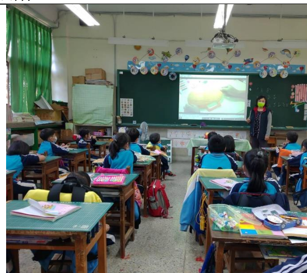
老師先說明今天所需準備的主題與材料