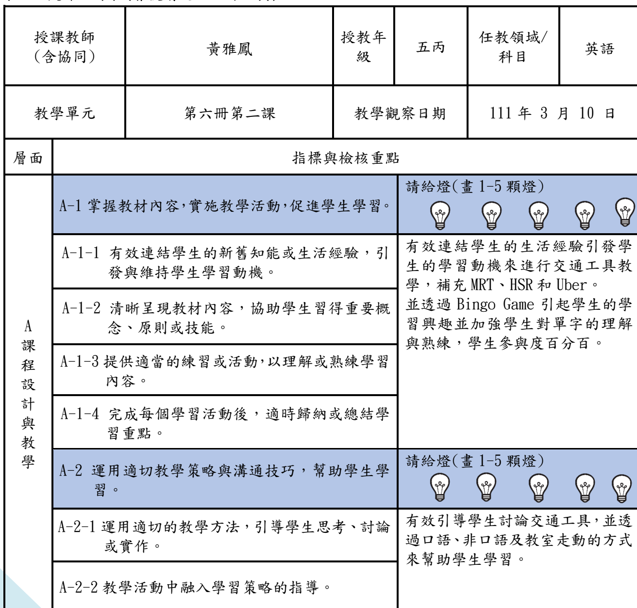
表 2、觀課紀錄表(會後請交回工作人員)