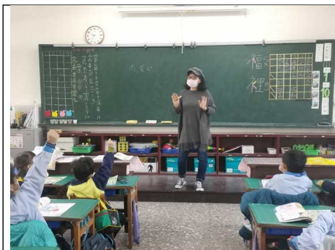
說明：詢問小朋友早餐吃哪些食物。