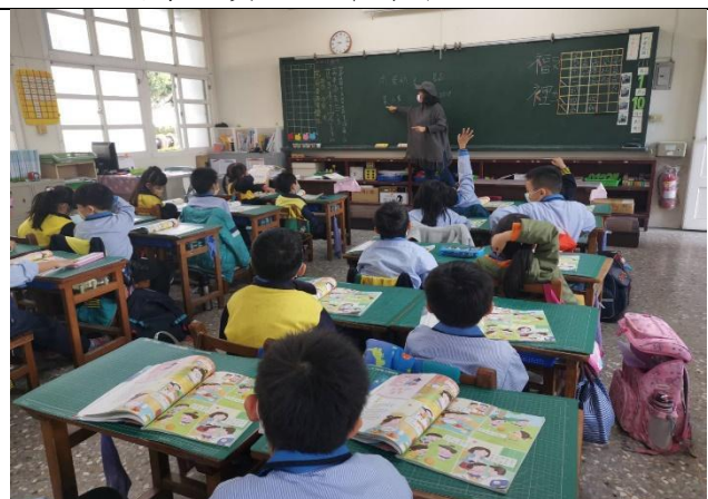
說明：同學踴躍發表哪些食物可以幫助長高。