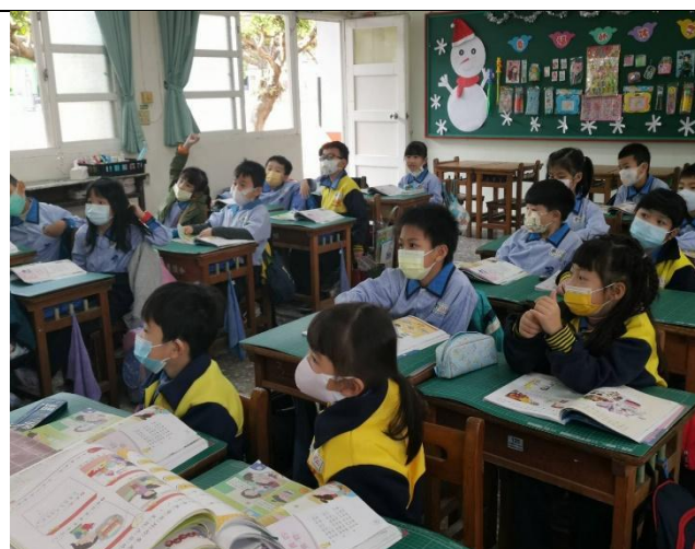
說明：同學認真聽老師講解。