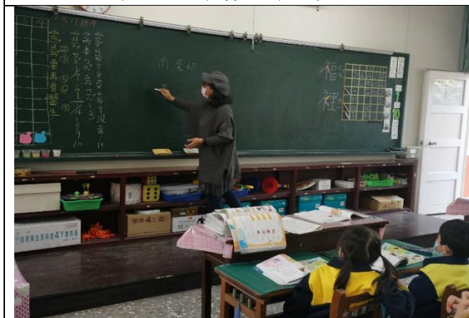
說明：說明不同食物對身體的幫助。