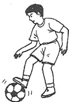
球滾來時把球輕踩停住

以足內側停球，是要停住地上滾來的球，球來時輕觸把球停住，腳底停球是用在，剛要反彈起來的球，球滾來時把球輕踩停住。