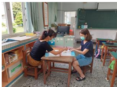
教學者說明教學目標及設計