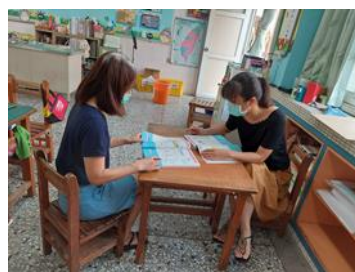
教學內容的討論與溝通