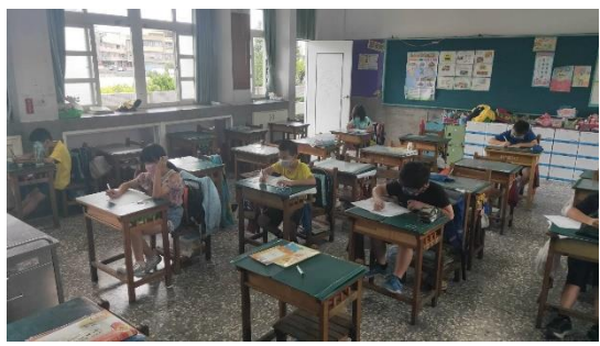
活動：教室觀察 日期：1110606