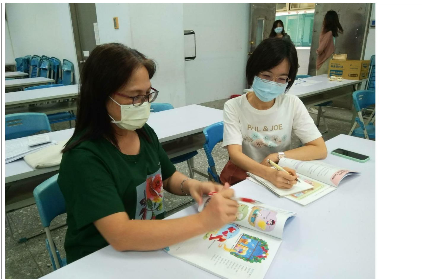
照片1說明：觀課前討論上課的流程