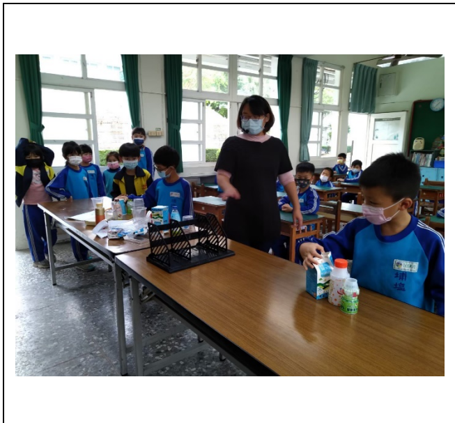
說明： 垃圾分類說明