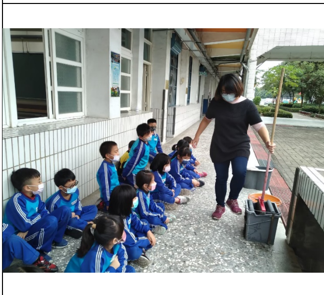
說明： 老師示範如何使用拖布盆擰乾抹布