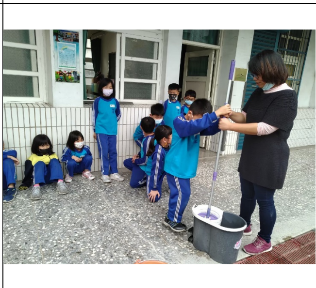
說明： 學生練習使用好神脫，老師在旁指導。