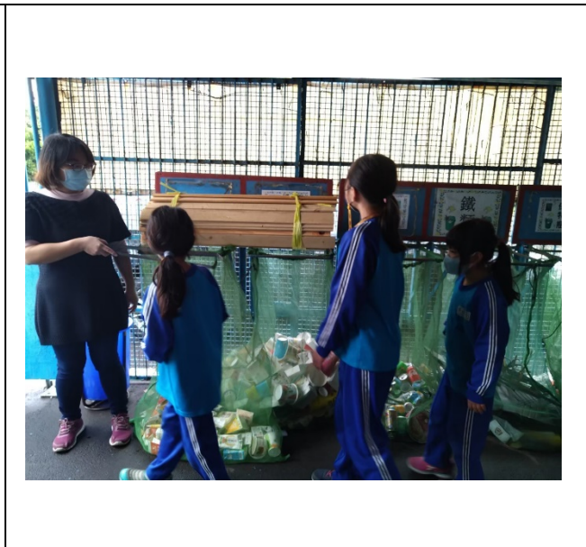
說明： 實際到回收室分類