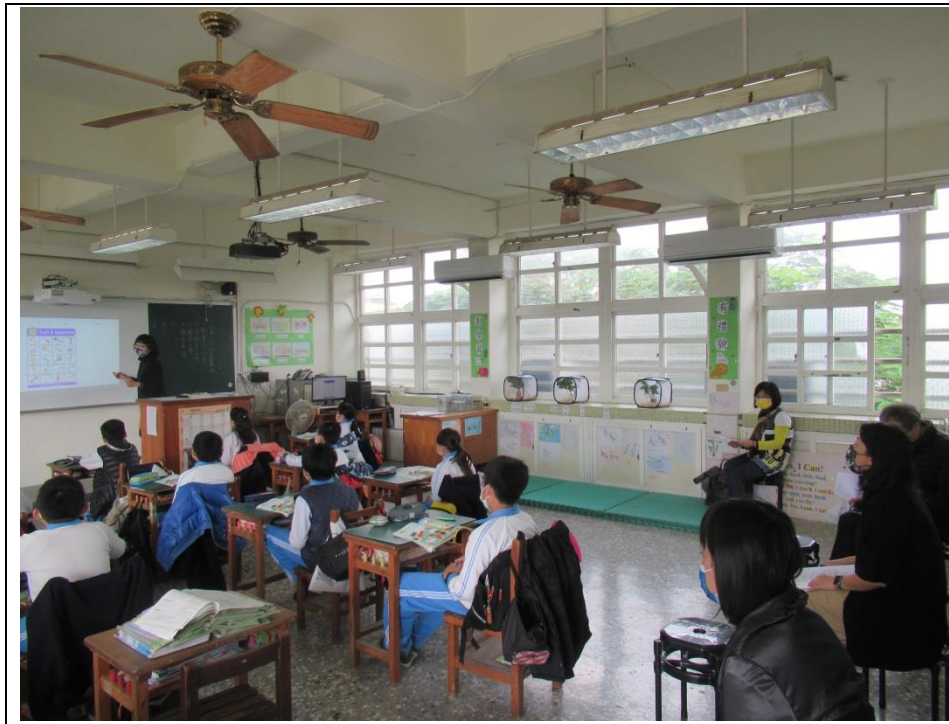
110 學年度彰化縣大園國小學校教師公開授課照片