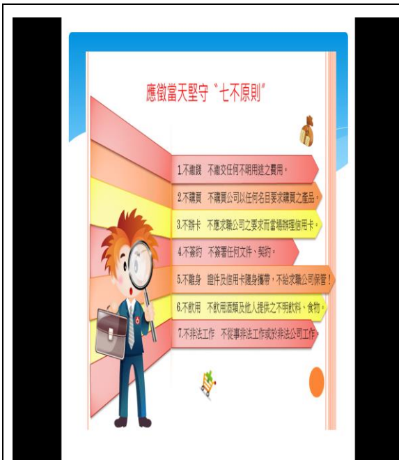
分享求職注意事項