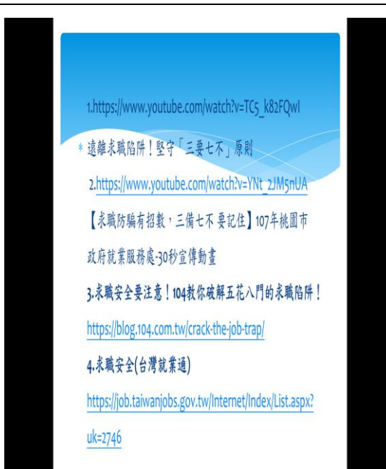
分享求職陷阱影片