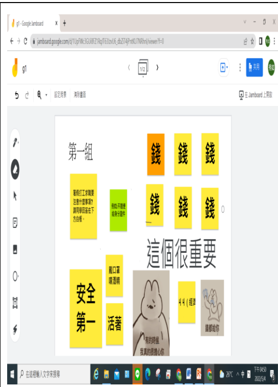
學生在 Jamboard 上討論