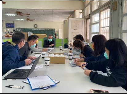
教師討論教學流程