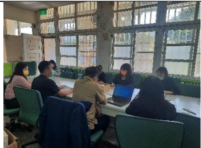
教師討論教學成效