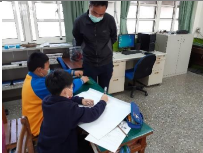
教師進行走動教學