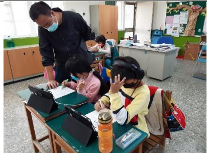
學生提問，教師進行個別講解