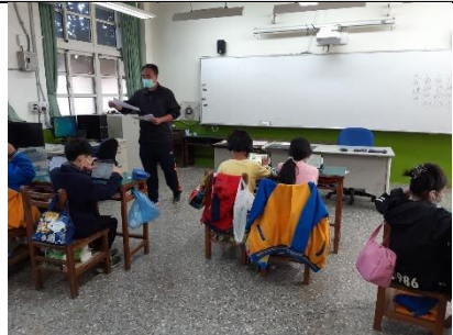
教師講解課程內容