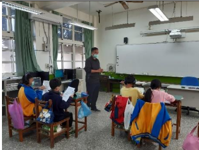
教師講解上課規範及上課流程