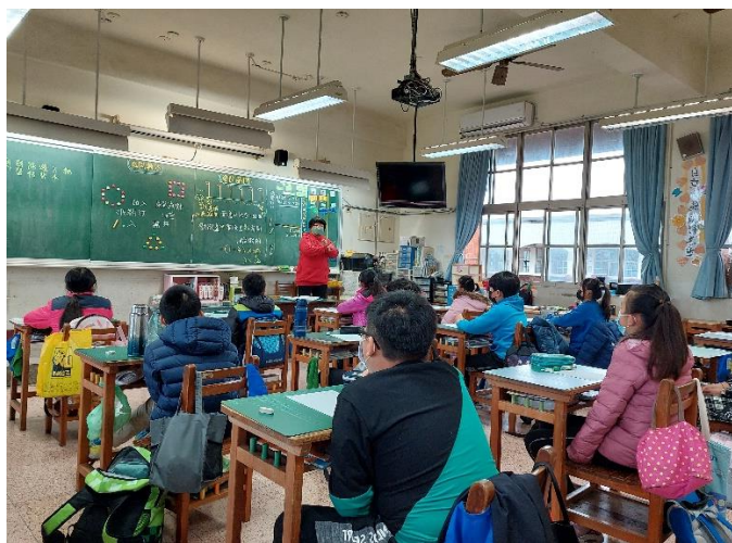
3. 間隔問題之澄清觀念