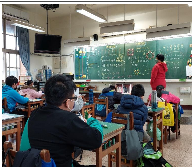
11. 學生發表後，教師對方陣問題歸納分析