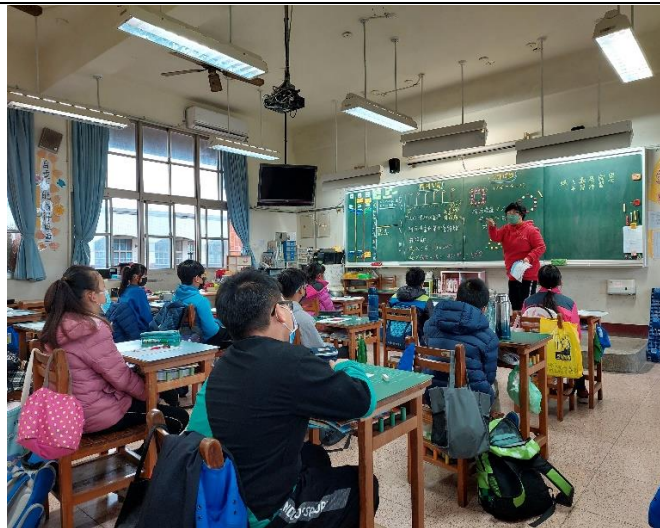
7. 方陣問題---正方形布題後解說 [方法二]