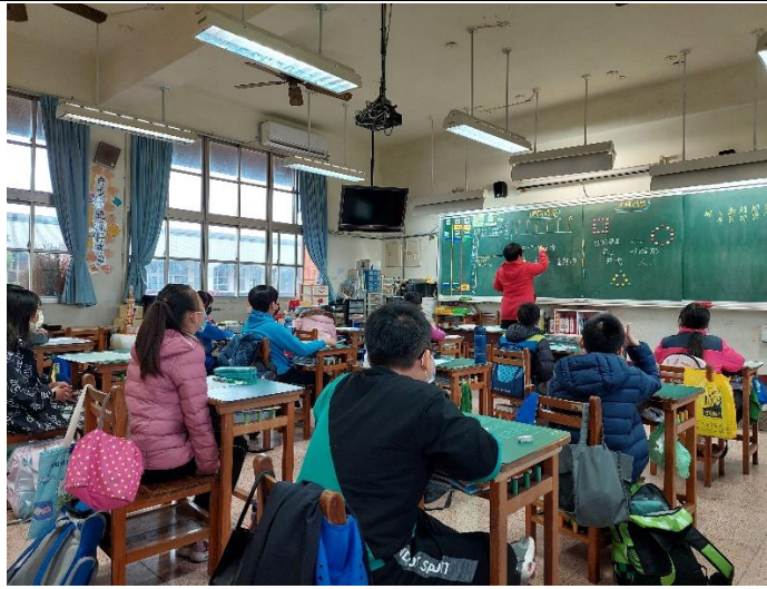
1. 間隔問題---開始布題