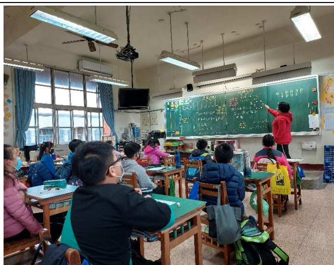
9. 方陣問題---每邊 3 人數，改成六邊形排列