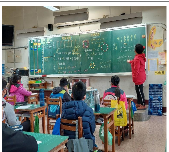
10. 如果六邊形每邊有 13 人呢？掩就不畫了哈~