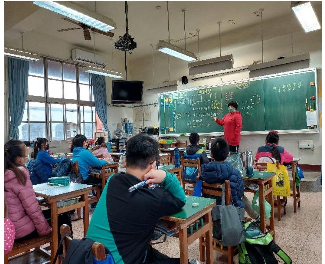
2. 間隔問題之簡易題型說明