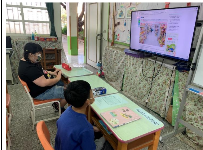
認識便利商店位置與內部擺設