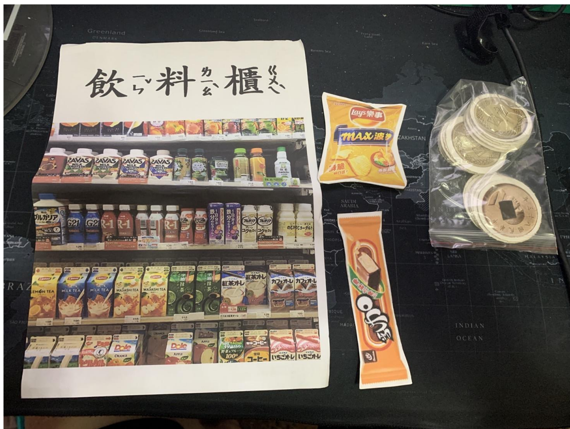
以教具介紹常見商品與商品分類。