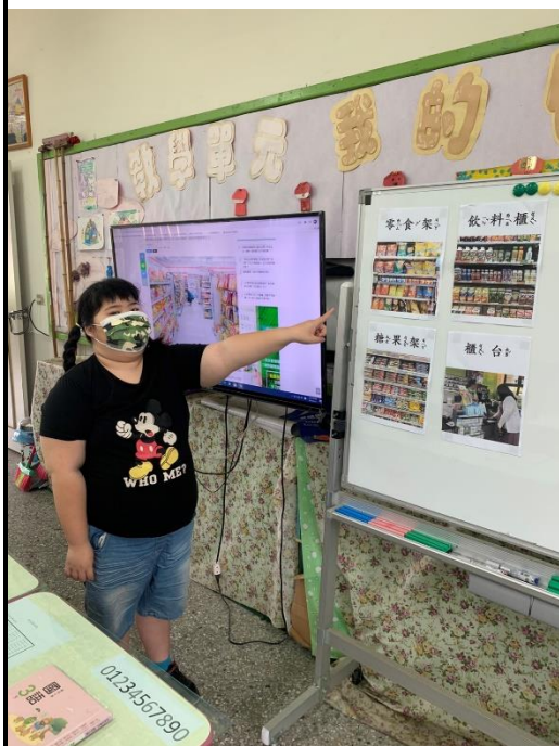
學生練習指認商品分類