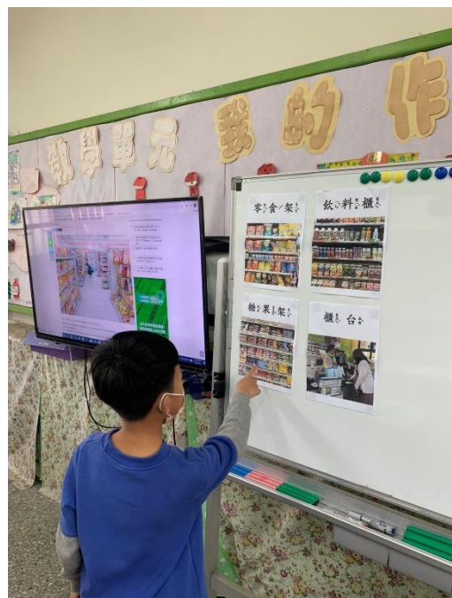
學生練習指認商品分類