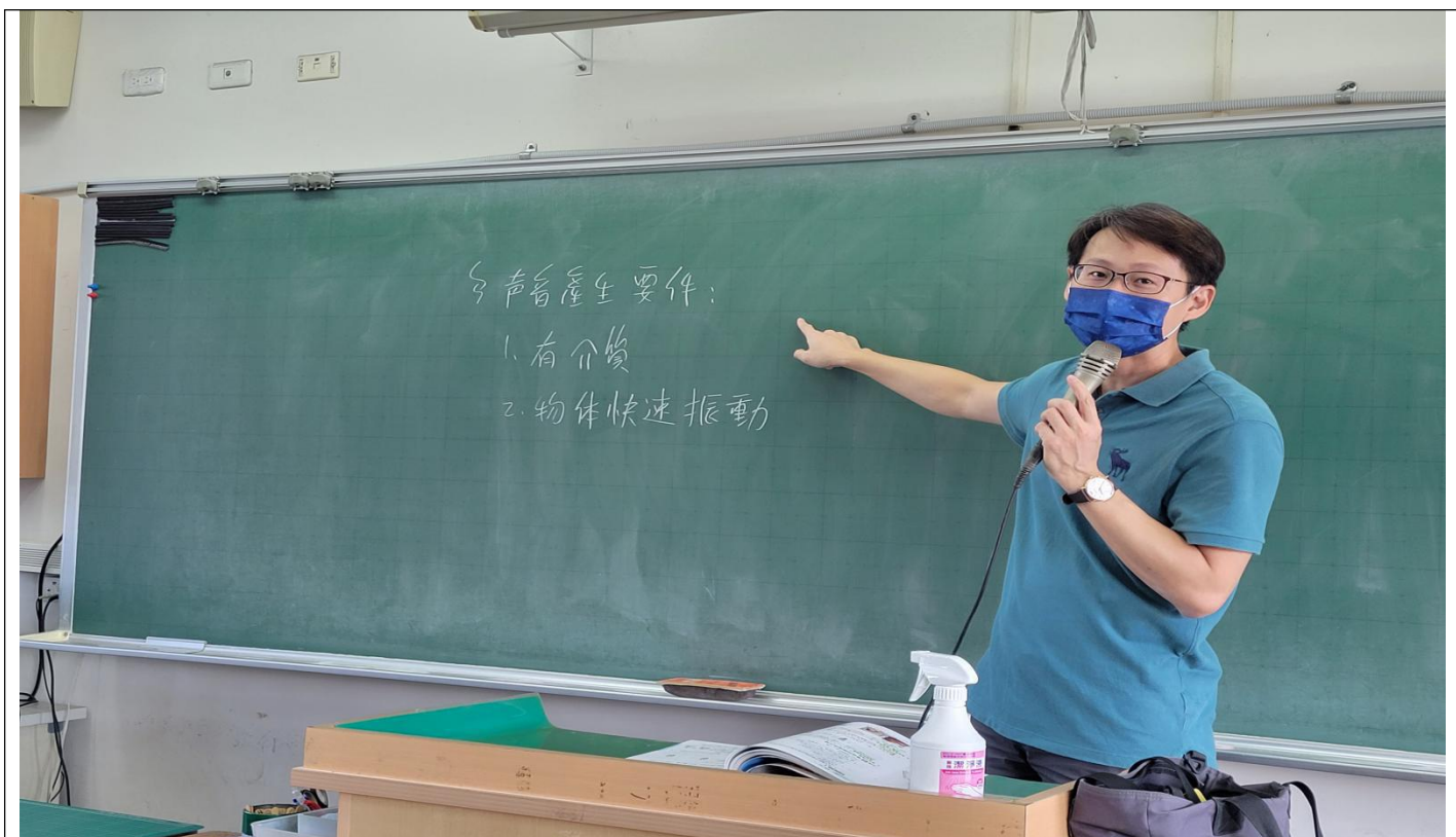
照片1說明：課前解說聲音的原理