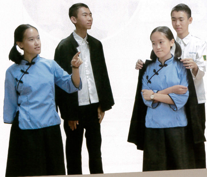
圖5 搭配手勢、服裝及道具來演練，可以增加渲染力，讓演員和觀眾更投入劇情喔！

除了演員之外，我們也要做一位有素養的觀眾，靜靜欣賞其他組別的表演，並在最後給予回饋喔！