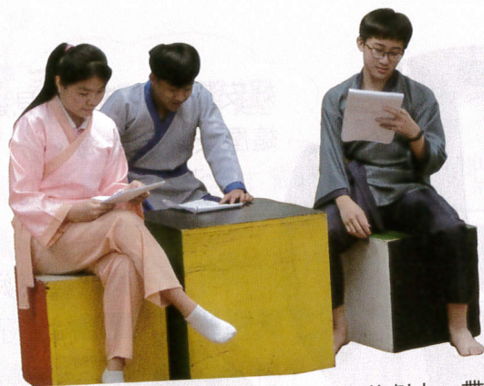
圖3 重複排演時，可以先拿著劇本，帶入角色動作，並試著熟記角色臺詞。