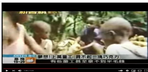
甜美巧克力背後童工辛苦血汗