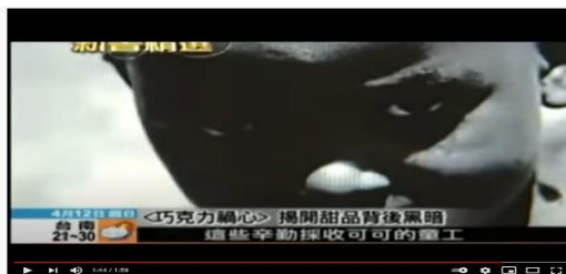
甜美巧克力背後童工辛苦血汗