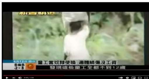
甜美巧克力背後童工辛苦血汗