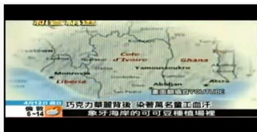
甜美巧克力背後童工辛苦血汗