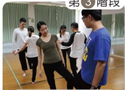
第 3 階段