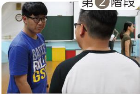
第 2 階段