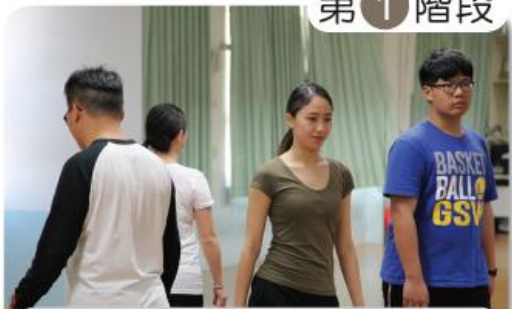
第 1 階段