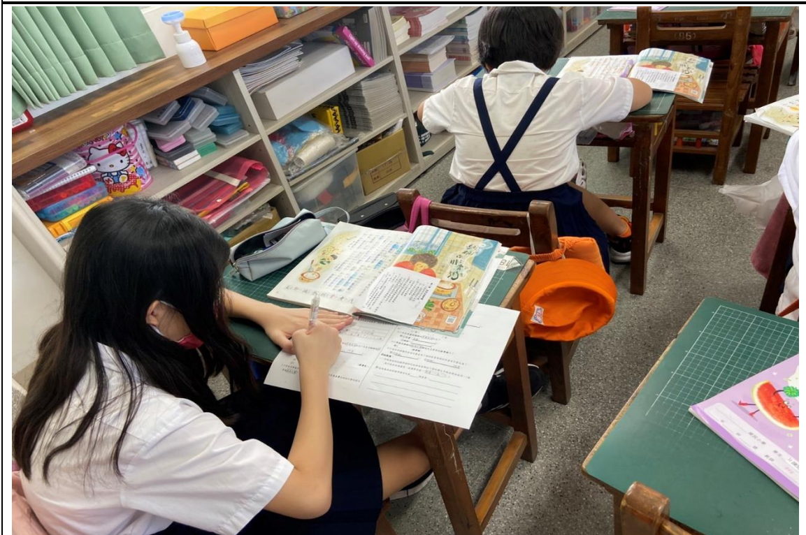
活動：四丙公開課——提問單習寫 日期：111/09/15