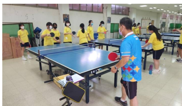
( 照片敘述 )