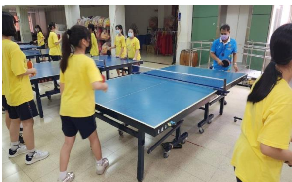
( 照片敘述 )