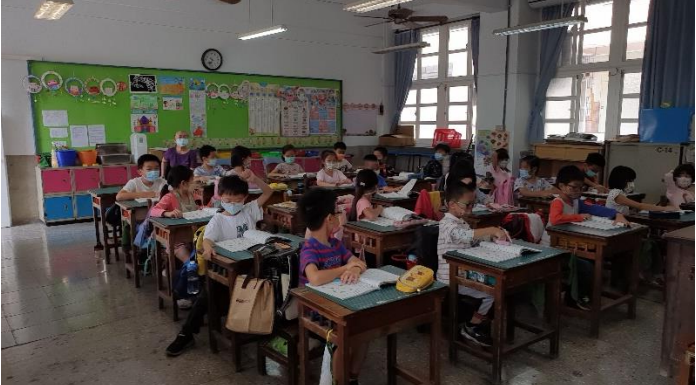
運用教室內的實際物品舉例操作