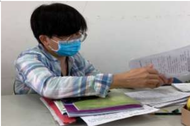
備課照片 1：(文字說明)