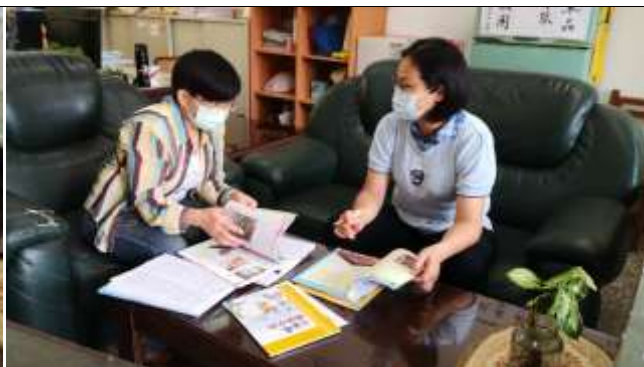
公開授課照片 2: (文字說明)