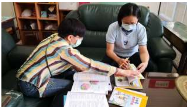
公開授課照片 1: (文字說明)