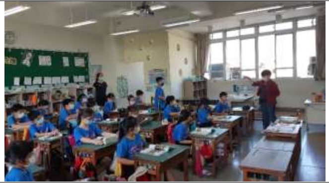
公開授課照片 4：（文字說明）