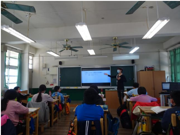
介紹古體詩與近體詩