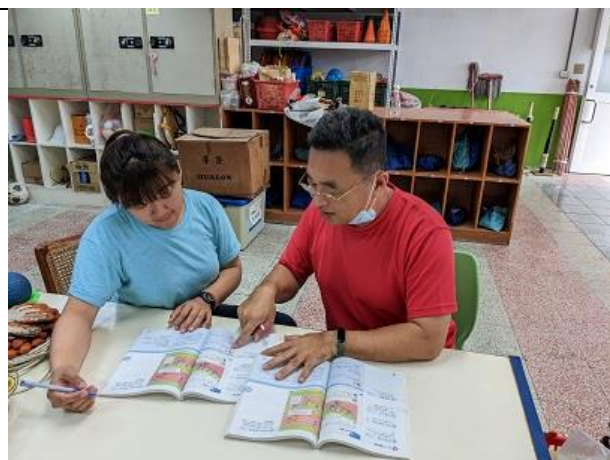
備課照片 1：（文字說明）