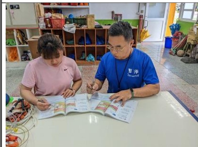
議課照片 1：（文字說明）