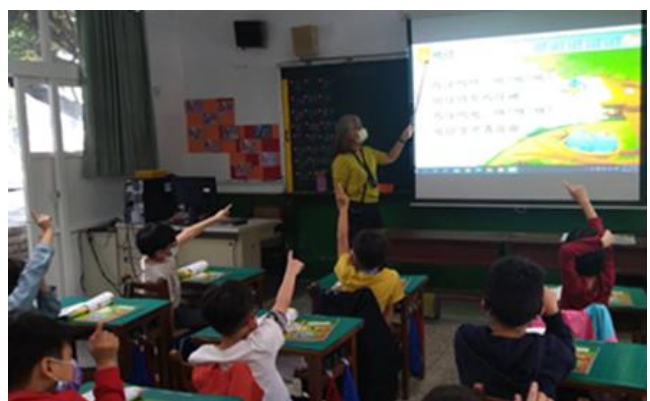
逐字逐句帶著學生朗課文