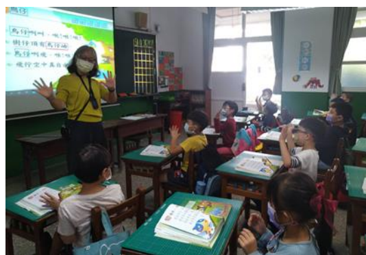
透過律動，引導學生進一步熟稔課文內容。