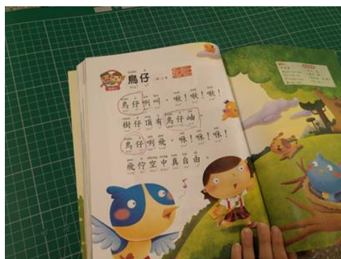
讓學生用筆圈出主要的語詞，評估學生對本課語詞的學習成效。