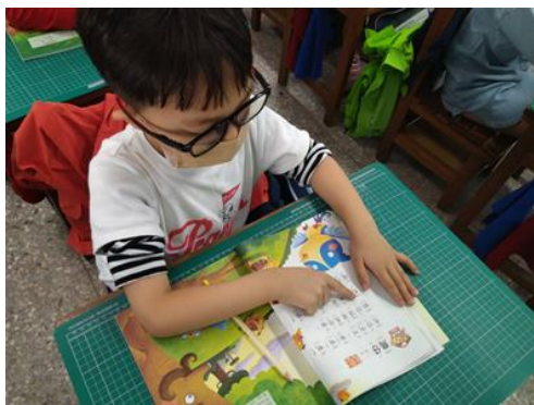
學生用手指指著課文朗讀