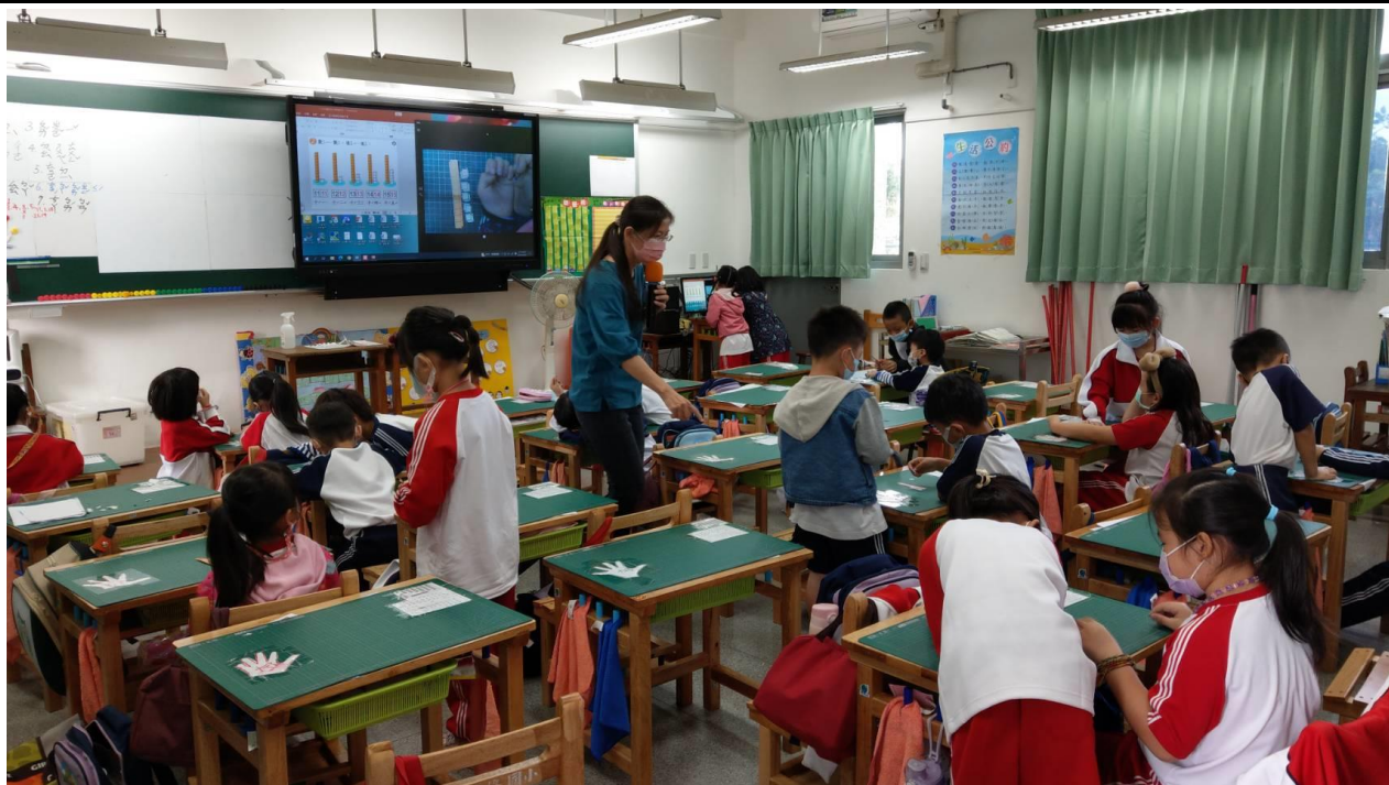
活動：教室觀察 日期：1111107