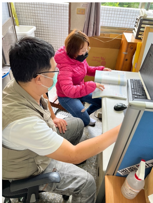
議課 (日期： 11/8 )