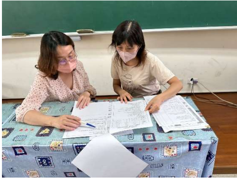
說明：教案說明與討論