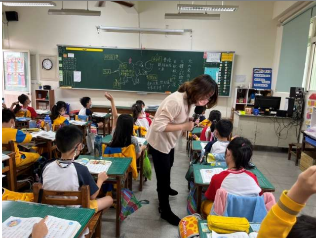
說明：學生回答問題