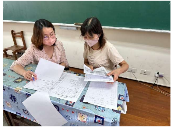
說明：教案說明與討論