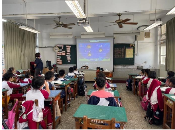
上課引起動機：觀賞蜘蛛派對