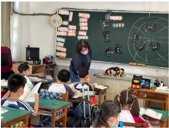
上課中指導學生作答